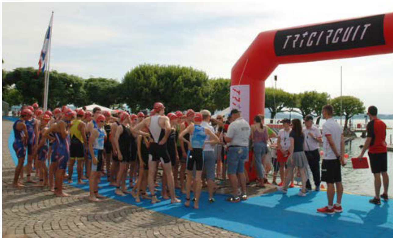
Das Warten hat ein Ende: Der 27. Zytturm-Triathlon wird am 11. und 12. September ausgetragen.

Zug Nach der Absage im 2020 wurde auch der diesjährige Zytturm-Triathlon coronabedingt aufgeschoben. Da die epidemiologische Lage mittlerweile aber wieder Grossanlässe erlaubt, wurde nach intensiven Diskussionen im Organisationskomitee und nach Rücksprache mit der Stadt Zug entschieden, den 27. Zytturm-Triathlon am Wochenende vom 11. und 12. September durchzuführen. Erwartet werden rund 900 Teilnehmer und über 250 Helfer werden dafür sorgen, dass der Anlass auch in der speziellen Coronazeit für alle Teilnehmenden sowie für die Zuschauer positiv in Erinnerung bleiben wird. > Seite 4/5