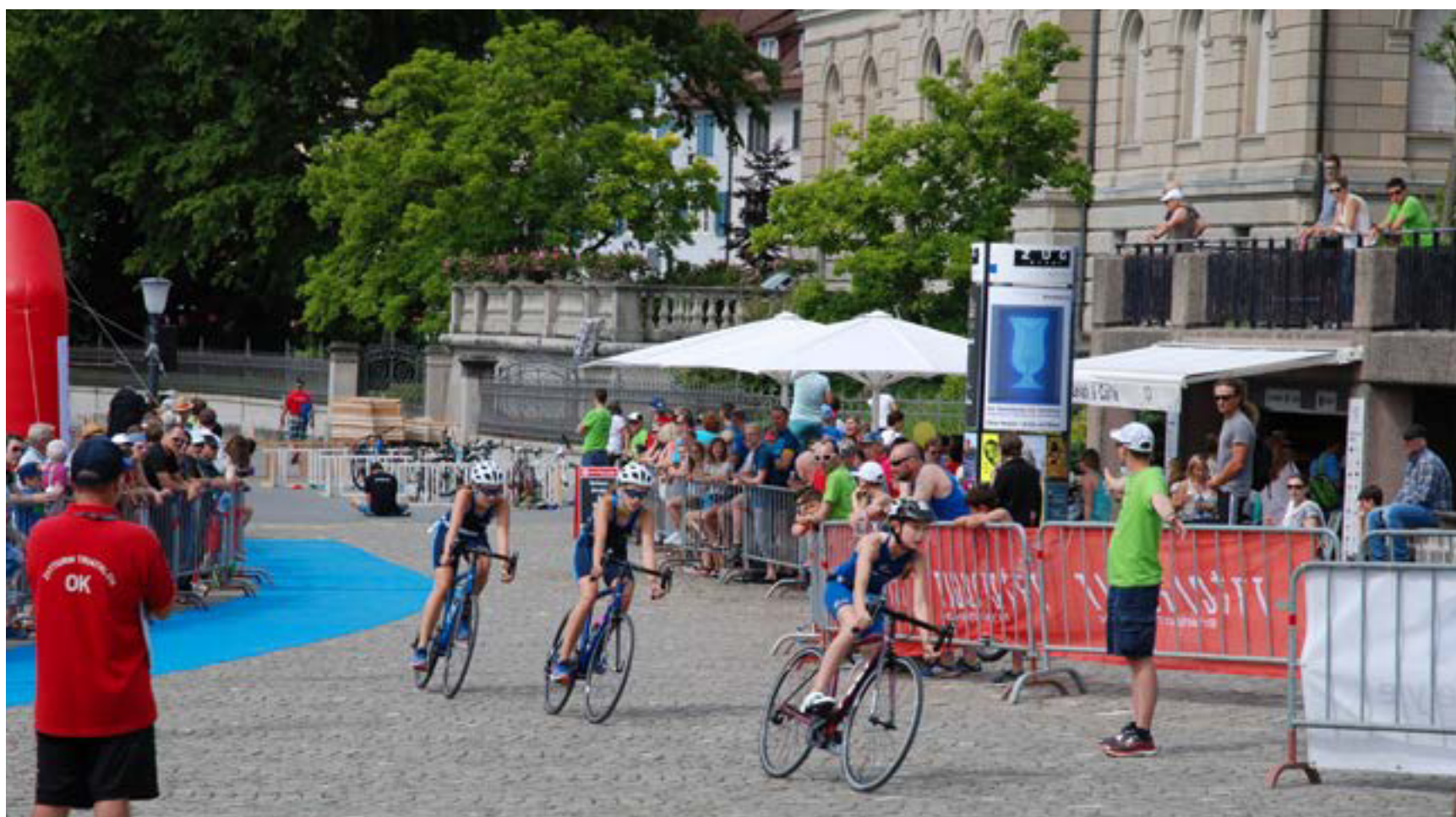
Trotz den geltenden Covid-Schutzmassnahmen lockt der Zytturm-Triathlon auch dieses Jahr wieder rund 900 Athleten an den Start.