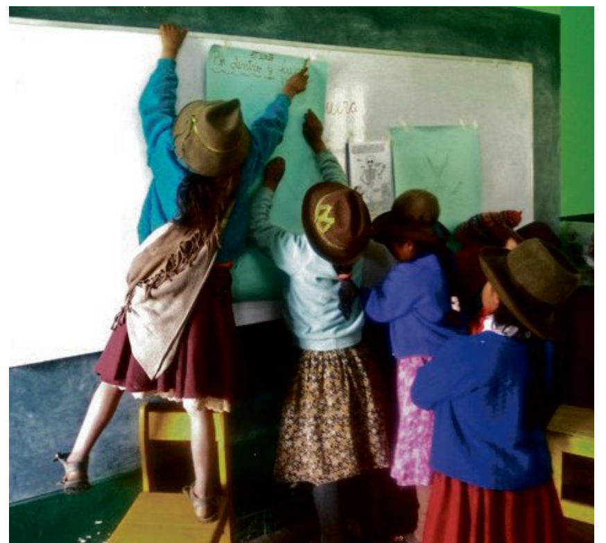
Als Anerkennung für ihre Arbeit wurde Amantani im Jahr 2012 als lateinamerikanische Menschenrechtsorganisation des Jahres ausgezeichnet.

Mädchen lachen viel, haben begeisterte Gesichter und, wenn auch ein wenig schüchtern, waren sie daran interessiert, sich in ein Gespräch zu verwickeln, wenn sie entdeckten, dass ich ein klein wenig Spanisch sprechen konnte. Ich habe eine Mathematiklektion beobachtet und war ziemlich beeindruckt. Den Kindern wurde Kopfrechnen beigebracht und zwar durch ein einfaches System mit den Fingern. Ich war überwältigt von dem Fort-